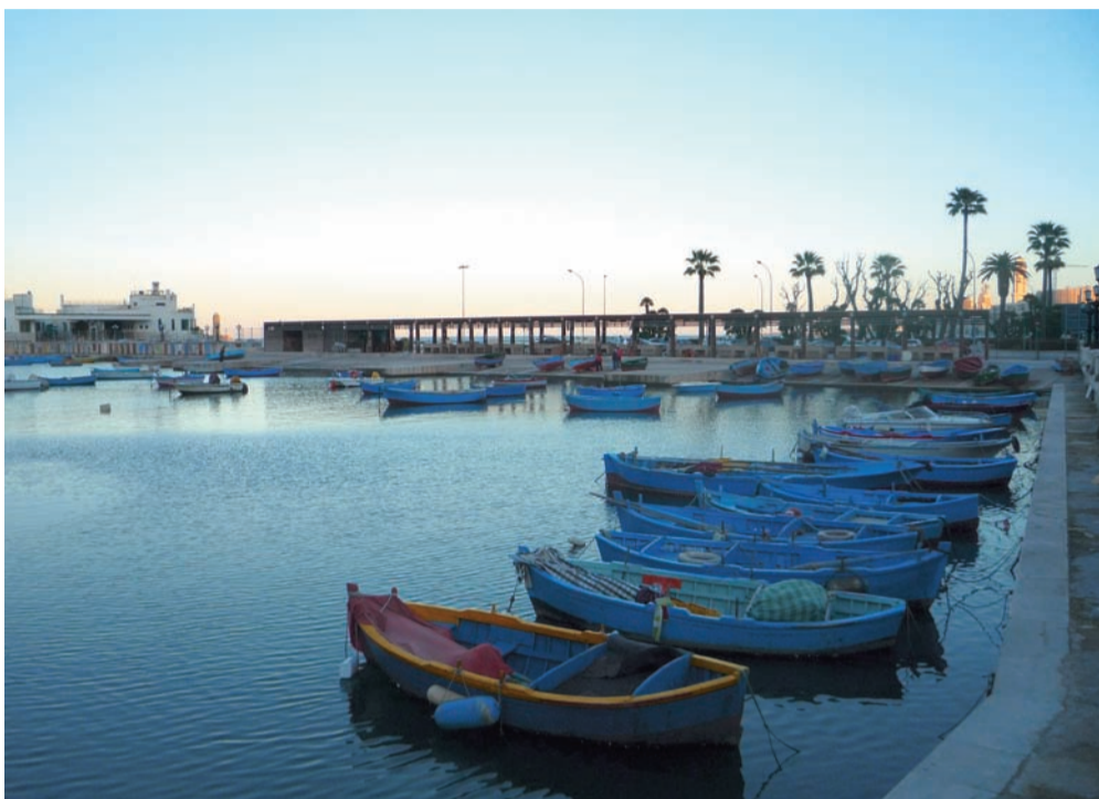
Bari, il Barion

L'aggregazione territoriale degli avvocati può ottenere l'iscrizione di diritto del proprio organismo di gestione nell'elenco de-