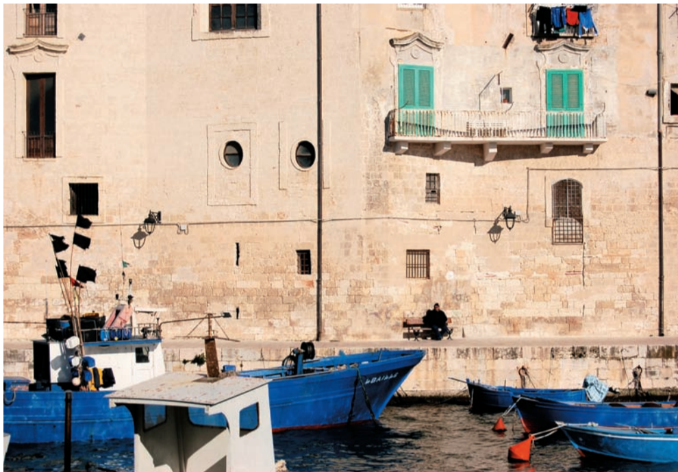
Monopoli, il porto.

Bari potrebbe diventare un polo di sperimentazione. Basterebbe affidarsi a una buona società informatica.