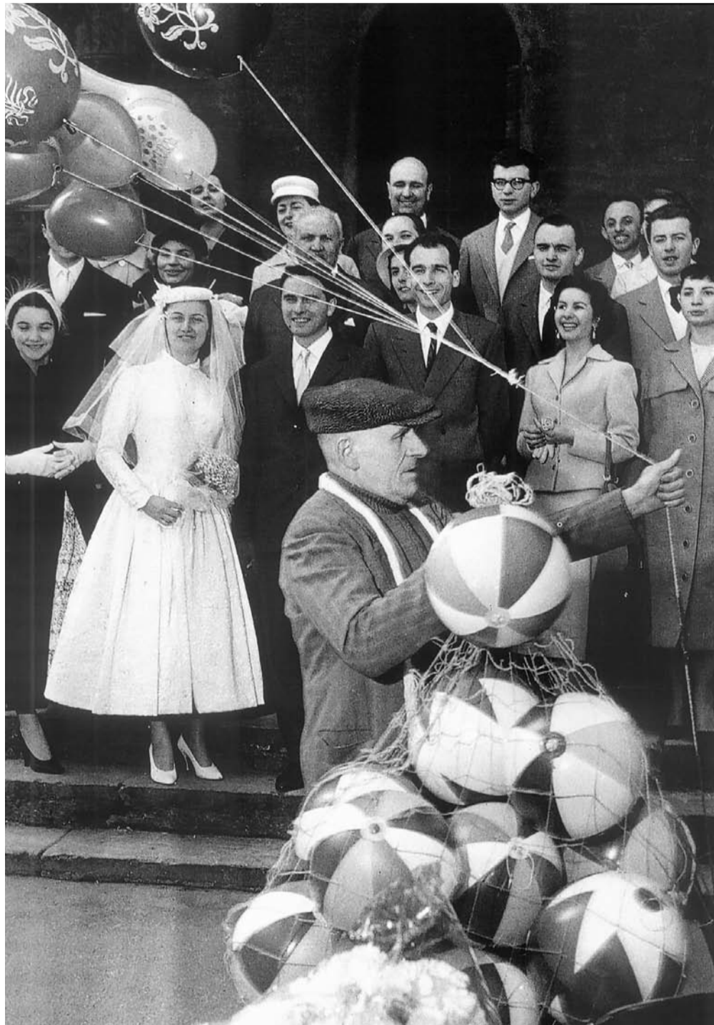
Emilia, 1952. Foto Nino Migliori (da GLI ANNI DEL NEOREALISMO, Tendenze della fotografia italiana, pag. 85, Edizioni FIAF, 2001)

Siamo arrivati dunque ad una conclusione definitiva, o vi sarà un futuro ulteriore ripensamento?