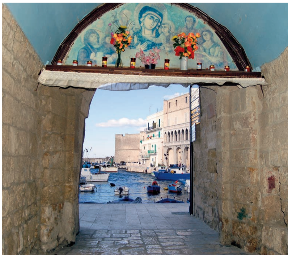
Monopoli, il porto.

Alla fine degli anni '90 da parte di alcune forze politiche vi è il tentativo di sopprimere gli ordini professionali, tacciati di un anacronistico corporativismo.