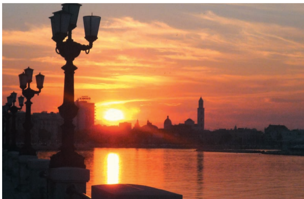
Bari, al tramonto

Per ora mi fermo, qui; credo che ci sia già abbastanza per riflettere.