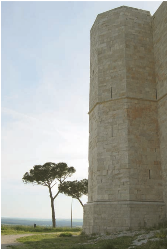
Castel del Monte.

Senza trascurare il dato essenziale, sul quale tutti gli Ordini dovrebbero interrogarsi, che a differenza di quanto previsto nel regolamento del 2007, il cnf, con l'entrata in vigore (segue a pag. 5)