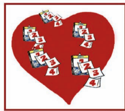
PREFAZIONE DI TIZI VENDOLA

DIARIO DI UN UOMO QUALUNQUE (POESIE D'AMORE E ALTRO ANCORA) LUGLIO 1974 - APRILE 2010