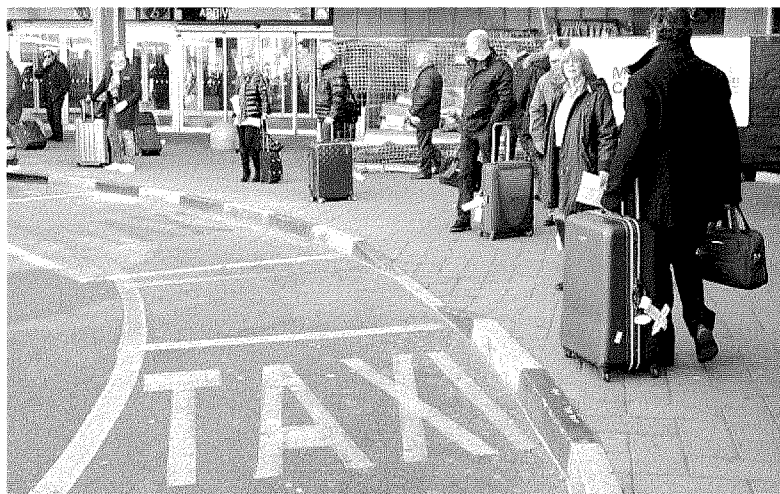
Posteggi dei taxi vuoti ieri a Roma